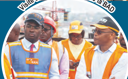
Lancement officiel de la campagne de sensibilisation autour du PTUA